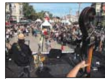
Total Festum à Montpellier. B. C.

12 000 manifestants sont attendus, demain, à Béziers qui deviendra le temps d'une journée capitale d'une grande Occitanie du Rhône au Limousin et au Béarn. Ce rassemblement pour la défense de la culture et de la langue occitane tient à la fois de la démonstration de force - pour interpeller le pouvoir politique - mais aussi d'un vaste forum (allées Paul-Riquet) visant à démontrer que l'Occitanie reste vivante et productive.